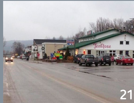
Pohénégamook 20 | Témiscaming 21