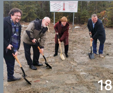
Nicolet 12 | Pohénégamook 13 | Saint-Donat 15 Saint-Siméon 16 | Témiscaming 17 | Weedon 18